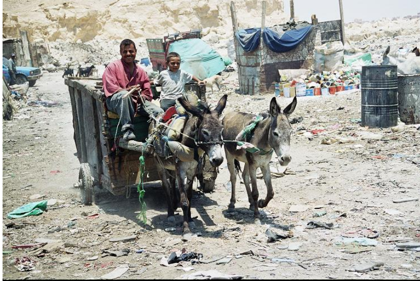
Aan het werk Op een vuilnisbelt in Cairo, Egypte