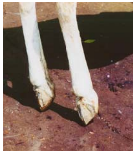
Vergroeide hoeven door verkeerde hoefijzers